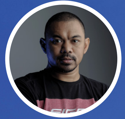
Hendra Sonie Journalist & Photographer