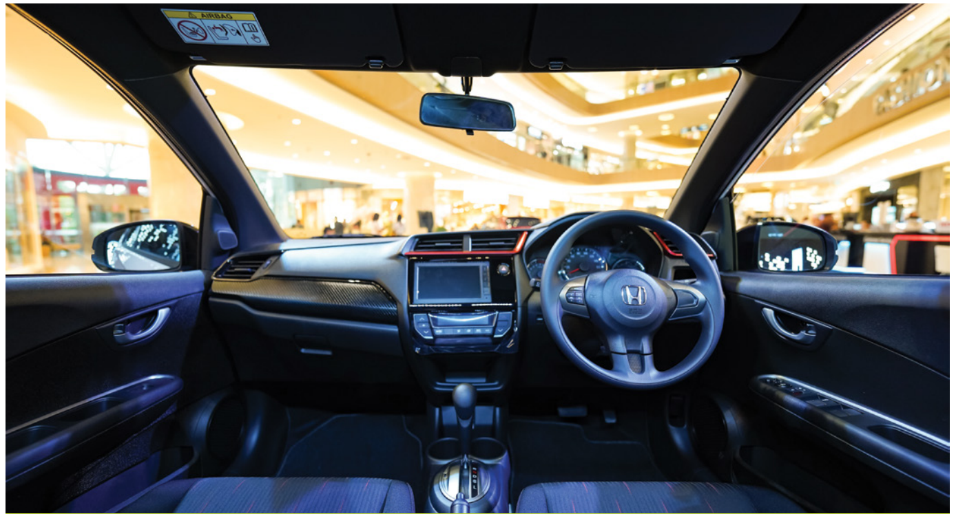
New Sporty Dashboard Panel Pattern with Red & Gray Lining

Honda Brio pertama kali diperkenalkan untuk konsumen di Indonesia pada tahun 2012 sebagai mobil entry level yang dirancang untuk anak muda dan first time buyer . Di pasar otomotif Indonesia, Honda Brio adalah salah satu model dengan penjualan tertinggi, bahkan Honda Brio pernah memecahkan rekor sebagai mobil dengan penjualan tertinggi di Indonesia pada tahun 2020, 2022, dan berlanjut hingga