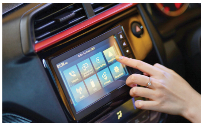
New 7" Advanced Capacitive Touchscreen Display Audio for RS CVT