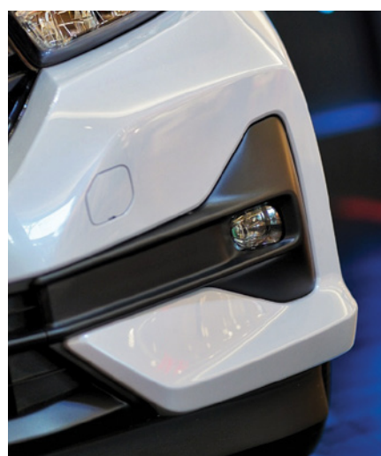
New LED Fog Lights

Bali dan Nusa Tenggara. "Kami percaya dengan desain eksterior dan interior yang semakin sporty dan stylish , fitur semakin lengkap, serta didukung mesin terbesar di kelasnya, New Honda Brio masih tetap menjadi produk favorit bagi konsumen," jelasnya.