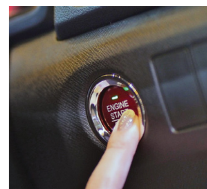
New One Push Ignition System

New Honda Brio dibekali dengan mesin 1.2L i-VTEC 4 silinder yang bertenaga 90 PS, yang merupakan terbesar di kelasnya, sekaligus hemat bahan bakar. Selain itu juga transmisi 5 M/T dan CVT dengan Earth Dreams Technology , Tweeter Speaker , ECO Assist , serta fitur keselamatan seperti Dual Front SRS Airbags , struktur rangka G-CON + ACE, dan sistem pengereman ABS + EBD.