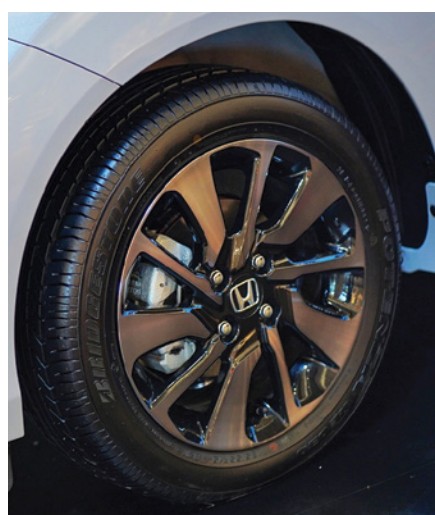
New 15" Dark Chrome Sporty Alloy Wheels