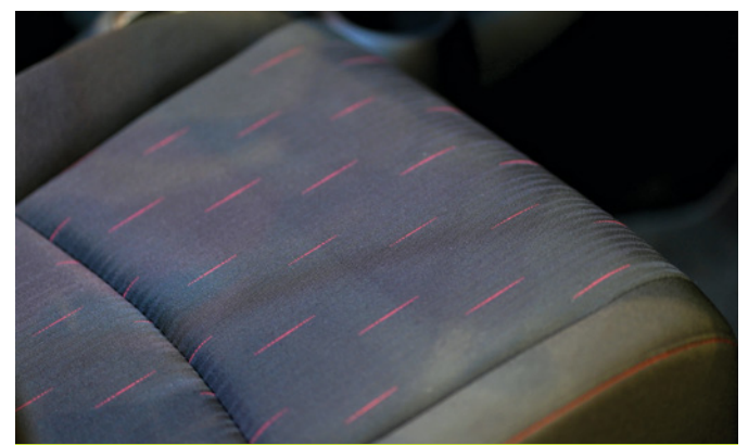
New Seat Pattern Design

kuartal pertama tahun 2023. Secara total, Honda Brio juga telah mencatat total penjualan lebih dari 500 ribu unit di Indonesia sejak awal diluncurkan hingga sekarang.